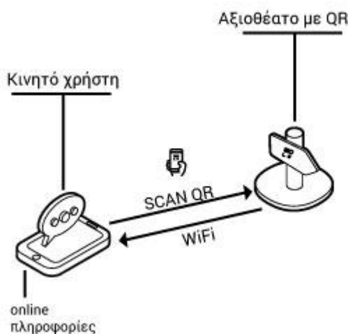
Εικόνα 2: Βασικό σενάριο χρήσης QR code